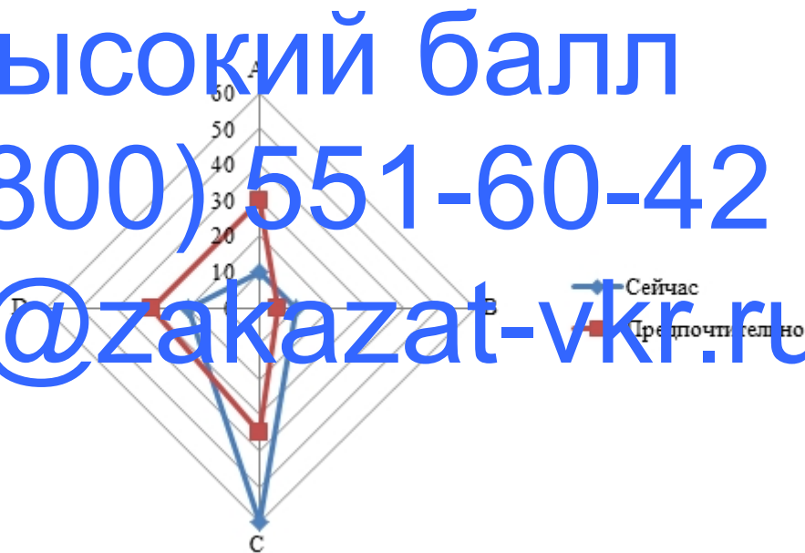
Рисунок 2.4. — Профиль элемента корпоративной культуры государственных служащих — «Важнейшие характеристики»