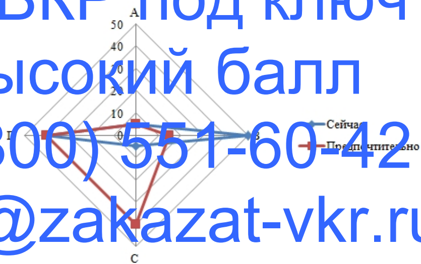
Рисунок 2.6. — Профиль элемента корпоративной культуры государственных служащих — «Управление работниками»

В ходе исследования причин столь больших разрывов в оценке параметров экспертами были получены следующие комментарии.