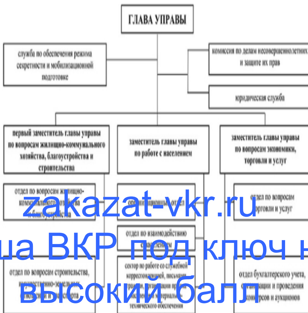
Рисунок 6 – Структура Управы

На рисунке 6 представлена структура Управы города Алматы. Как видно из древа иерархии, в управе отсутствует отдел по вопросам культуры и досуга. Необходимо учитывать и этот нюанс, так как Управа в данном вопросе более максимально эффективна и работоспособна.