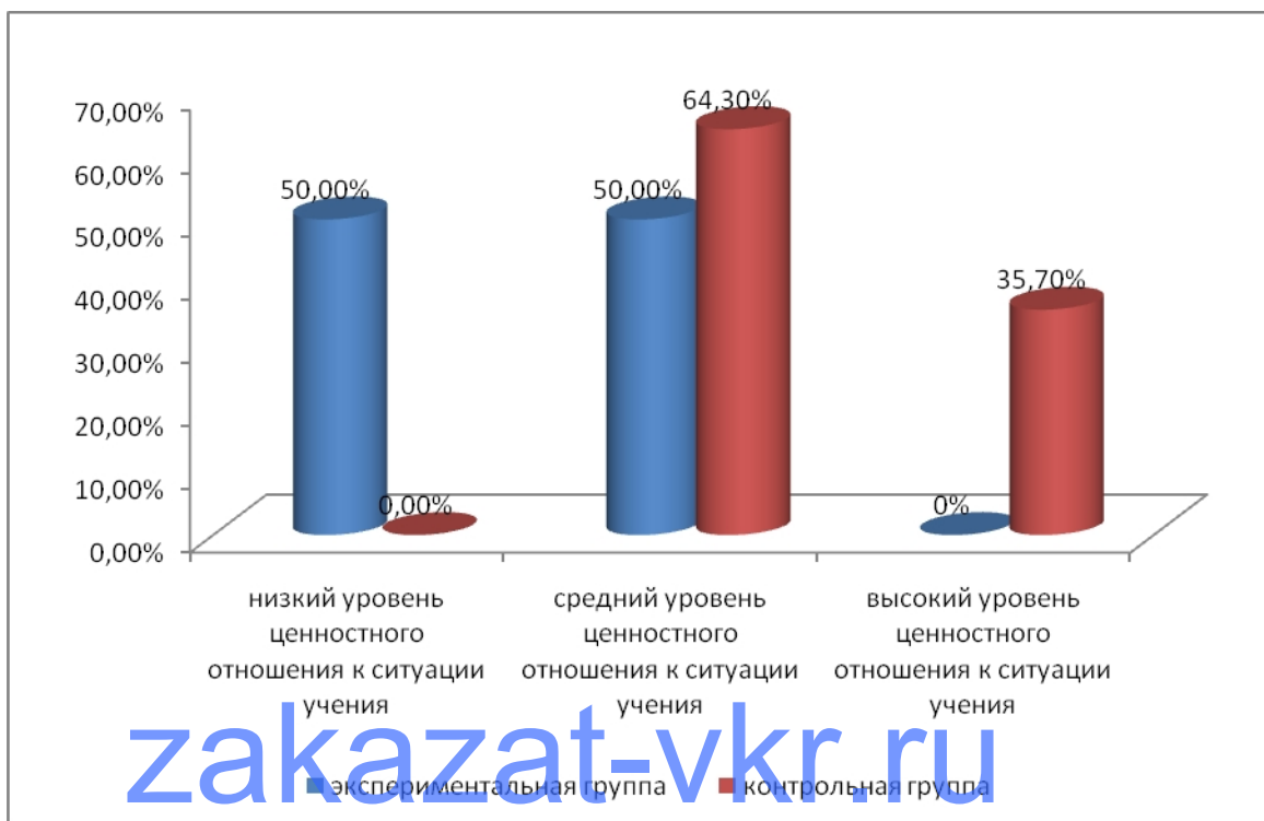
Рисунок 4 – Уровень ценностного отношения к ситуации учения младших школьников

Таким образом, полученные результаты свидетельствуют, что у отстающих младших школьников выявлен низкий уровень ценностного отношения к ситуации учения.