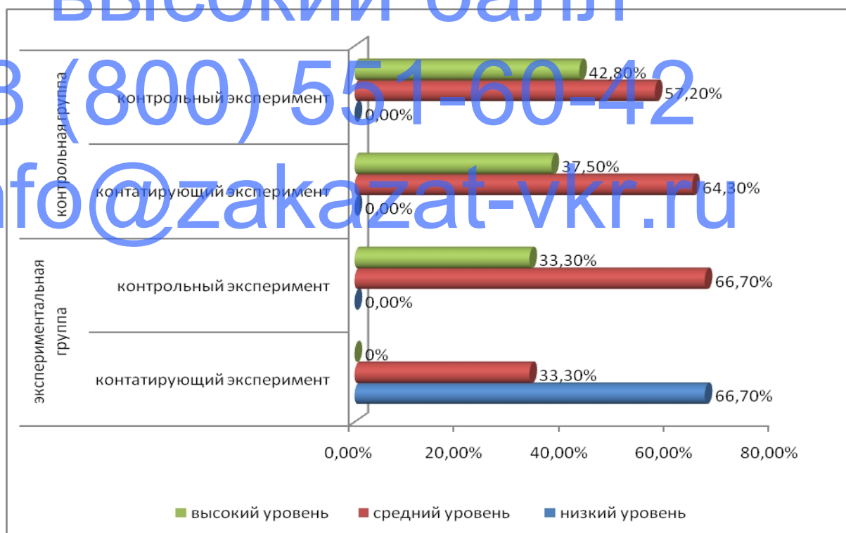
Рисунок 6 – Сравнительный анализ общего уровня успешности обучения младших школьников по итогам контрольного и констатирующего этапов

Сравнительный анализ общего уровня успешности обучения младших школьников по итогам контрольного и констатирующего этапов представлен на рис. 6.