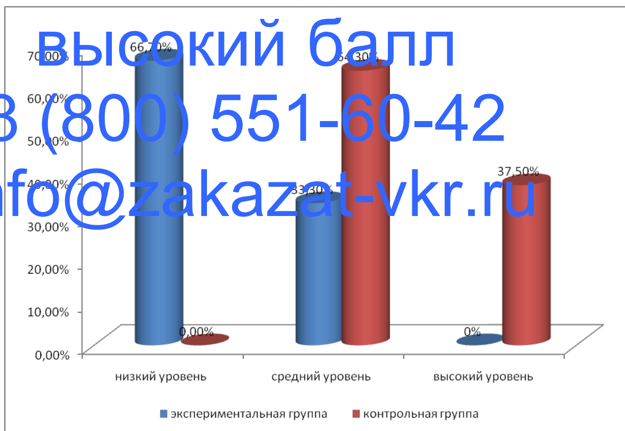
Рисунок 5 – Распределение младших школьников по уровню школьной успешности по итогам контрольного этапа