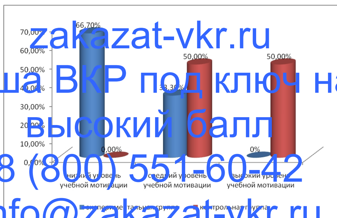
Рисунок 3 – Уровень учебной мотивации младших школьников

Таким образом, полученные результаты свидетельствуют, что у отстающих младших школьников выявлен недостаточный уровень мотивации.