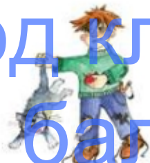
Дергать кота за хвост