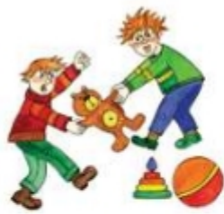
Отнимать игрушку у других детей