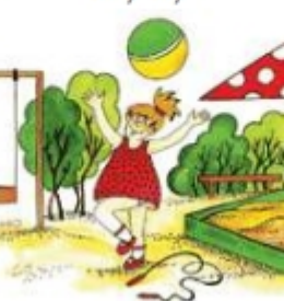
Девочка играет с мячом