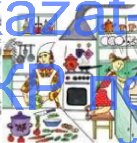
Дочка помогает маме готовить