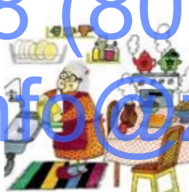
Бабушка готовит обед