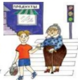
Переводить старушку через дорогу