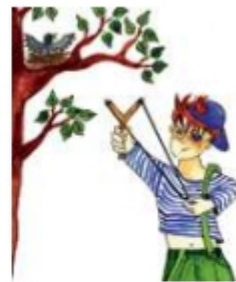
Стрелять из рогатки