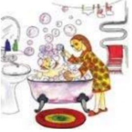
Мама моет дочку