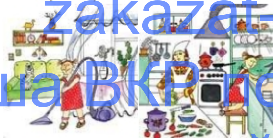
Дочка помогает пылесосить квартиру