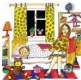
Мама читает дочке книгу на ночь