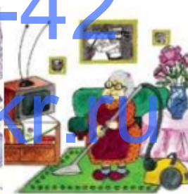
Бабушка убирается в квартире