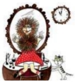
Дочка делает прическу