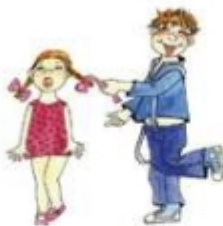
Дергать за косички