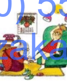
Бабушка разувает внучку