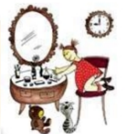
Дочка красится маминной косметикой