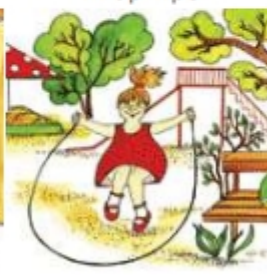
Девочка прыгает через скакалку