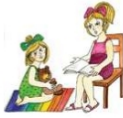
Читать книжку маленькой девочке