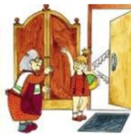
Девочка идет гулять