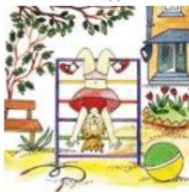
Девочка играет во дворе