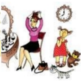
Мама собирается на работу