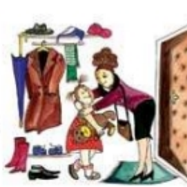
Мама одевается и прощается с дочкой