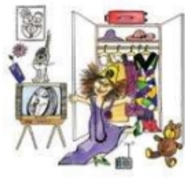
Дочка меряет мамины платья